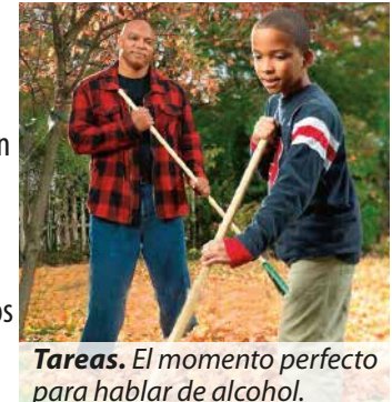
Tareas. El momento perfecto para hablar de alcohol.

Como una comunidad, a través de la educación, y programas de prevención basados en la evidencia, nosotros podemos enviar mensajes de prevención que pueden ser escuchados por adolescentes, padres, negocios, escuelas, y profesionales en el cuidado de la salud.